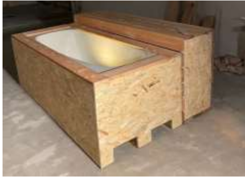
Bild der studentischen Arbeitsgruppe mit Badewanne auf Palette, m Plakaten und Kerzen realisierte Badewanne